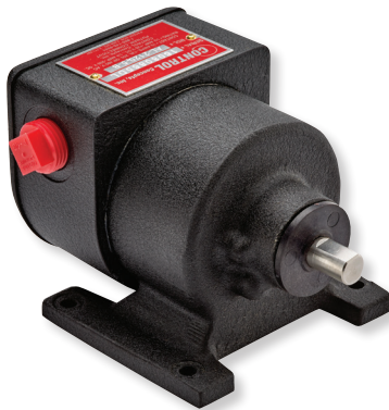
Serie 2100 & 8100 Montaje en Base (Electromecánicos)