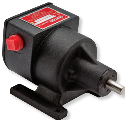
Serie 4100 (Electromecánicos)