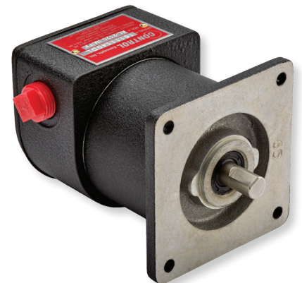
Serie 2100 & 8100 Montaje con Brida (Electromecánicos)